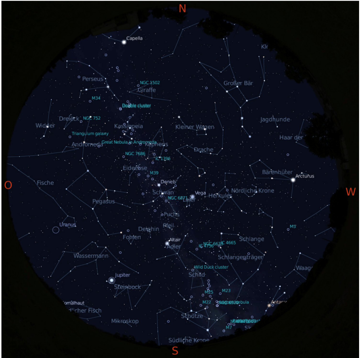
Grafik erstellt mit Stellarium 0.10.2 http://www.stellarium.org